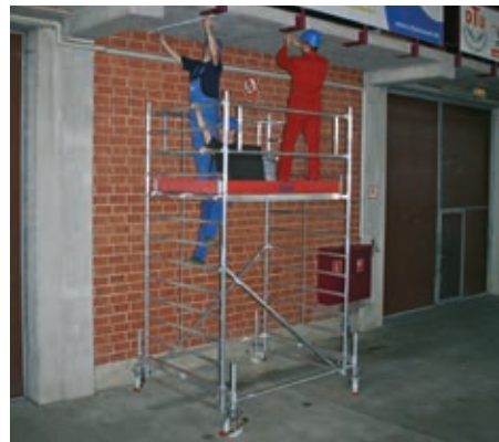
Длина помоста: 2,00 м – Ширина помоста: 1,50 м