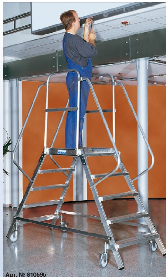
Арт. № 810595